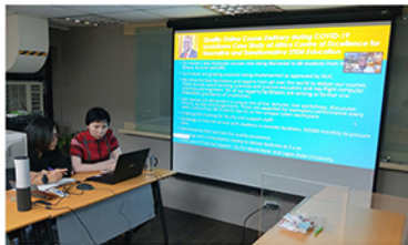
參與美國高等教育認可評議委員會(CHEA)網路研討會