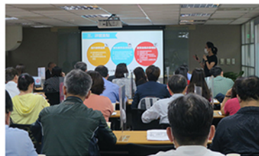
辦理【109年度至110上半年度技專校院評鑑相關工作計畫】說明會暨工作坊