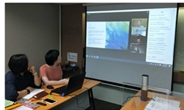
參與高等教育品質保證國際網路(INQAAHE)網路研討會