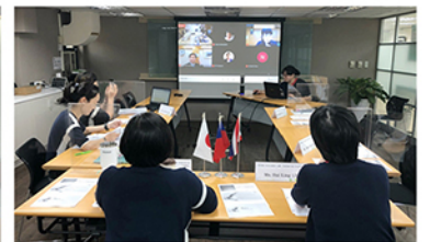
台、泰、日專業評鑑機構人員交流研討會