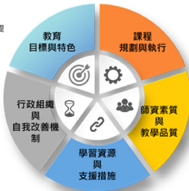
圖1-台評會「大專校院教學品保服務計畫」-通識教育品保構面

通識教育教學品保服務計畫共規劃「教育目標與特色」、「課程規劃與執行」、「師資素質與教學品質」、「學習資源與支援措施」、「行政組織與自我改善機制」等五個評鑑構面。