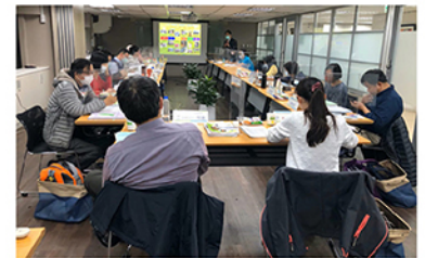
109年度審查各直轄市、縣(市)政府辦理社區大學業務暨全國社區大學申請獎勵計畫—地方政府簡報審查及社區大學分區審查