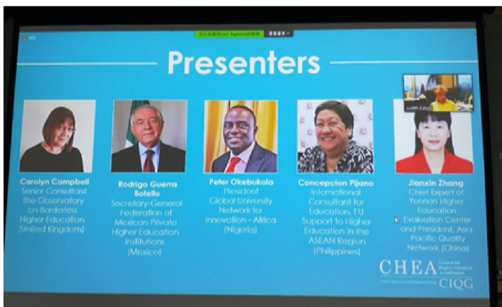
圖：美國高等教育認可評議委員會遠距教學網絡研討會講者列表