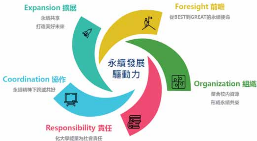
圖一 高科大永續價值觀-FORCE

高科大於2021年出版了首份《2020永續發展報告書》，宣示高科大實踐永續發展理念的決心。透過報告書的編撰，響應聯合國SDGs並揭露本校在教學、研究、環境、社會參與及治理面向等相關績效，展現促進平權、創新、經濟和科技，還有維護生態與社區福祉等永續作為。永續發展報告書匯聚了高科大教職員生不懈地努力，除了呼應全球永續發展使命，更要建立明確的目標和優先變革事項，期待高科大為永續發展做出更積極、具體的貢獻，同時也接受社會檢視本校推動永續相關的校務現況，督促高科大繼續成長。