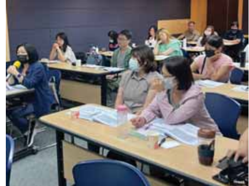
【高等教育深耕計畫實務經驗交流工作坊】發展性別平等教育—CEDAW融入課程與教學