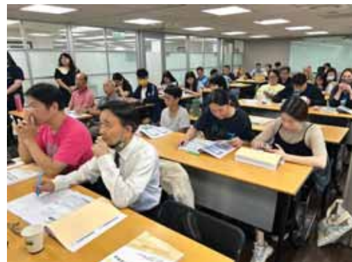
【113年辦理112年度非奧亞運特定體育團體訪視計畫】訪視指標暨作業說明會