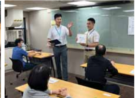
【2024年泰語能力檢定】高雄場（口說測驗）臺北場（口說測驗、閱讀能力測驗）