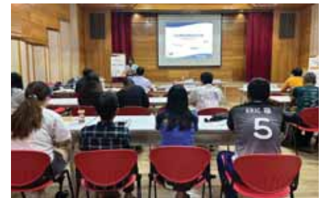
【113年辦理112年度非奧亞運特定體育團體訪視計畫】實務研習工作坊