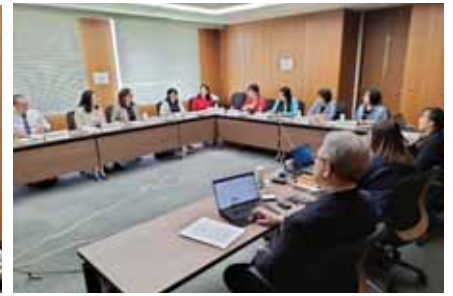
【IJAS國際聯合認證】台評會代表赴日與日本JUAA、蒙古MNCEA召開研商會議