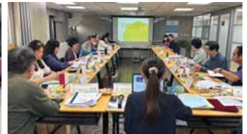
辦理教育部113年度審查地方政府辦理社區大學業務暨全國社區大學獎勵申請實施計畫一分區審查