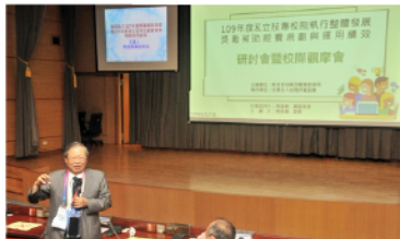
109年度教育部獎勵補助私立技專校院整體發展經費運用績效研討會暨校際觀摩會