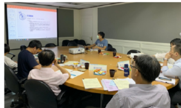
【109年度審查地方政府辦理社區大學業務暨全國社區大學申請獎勵實施計畫】輔導座談會