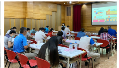
【109年度奧亞運特定體育團體訪評計畫】實務研習工作坊