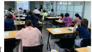
【109年精神照護機構評鑑計畫】精神照護機構評鑑衛生局說明會