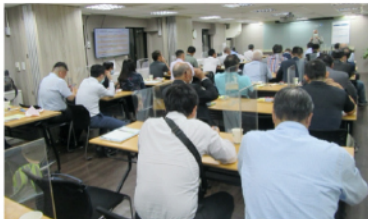
辦理體育紛爭仲裁專門知識講習課程