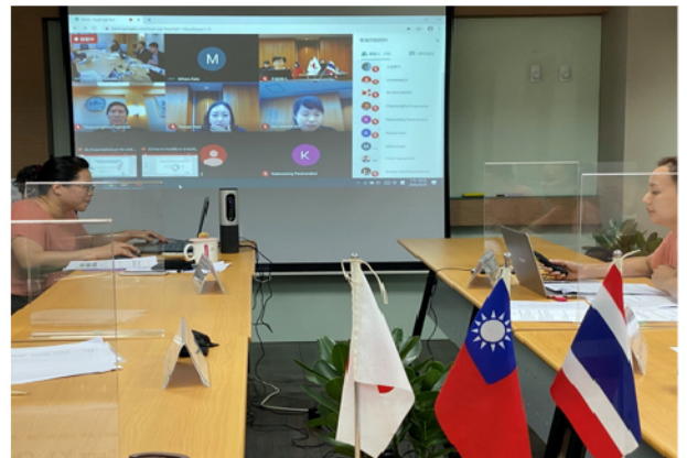
圖：台評會辦理台泰日專業評鑑機構跨國研習活動2