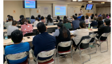
【109年精神照護機構評鑑計畫】精神復健機構機構說明會