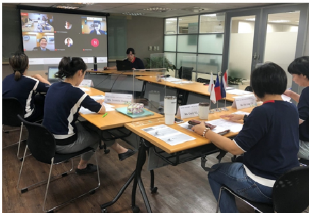
圖：台評會辦理台泰日專業評鑑機構跨國研習活動1

本次跨國研習為臺灣、日本及泰國三方專業評鑑機構提供人員密切交流、分享品保經驗, 促進跨國專業評鑑機構間人員實質經驗分享與開拓未來合作的機會。