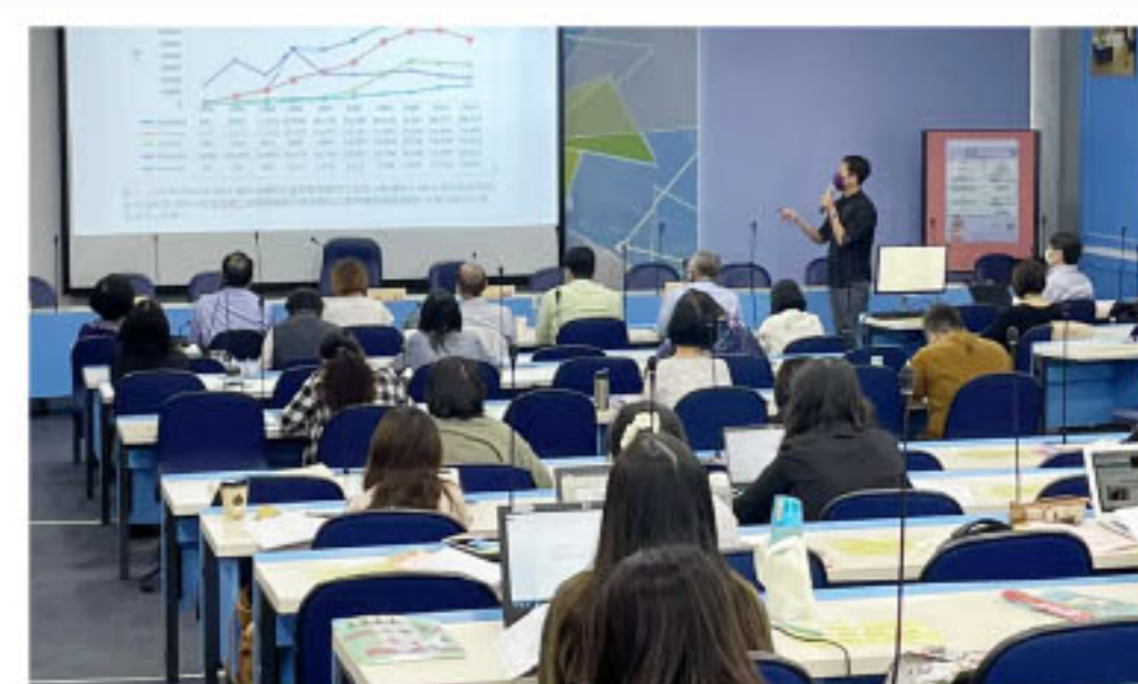
【全球華語文教育專案辦公室】辦理「國際華語文教育推廣分區交流會」(03.30南區、04.09北區、04.19中區)