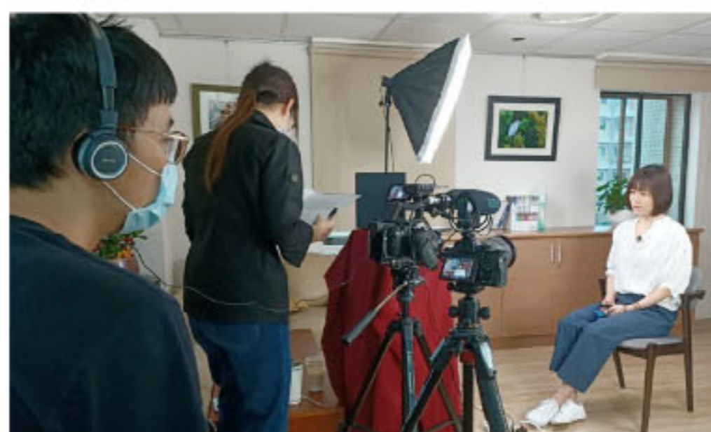
【全球華語文教育專案辦公室】拍攝華語教學人員經驗分享《捷克篇》