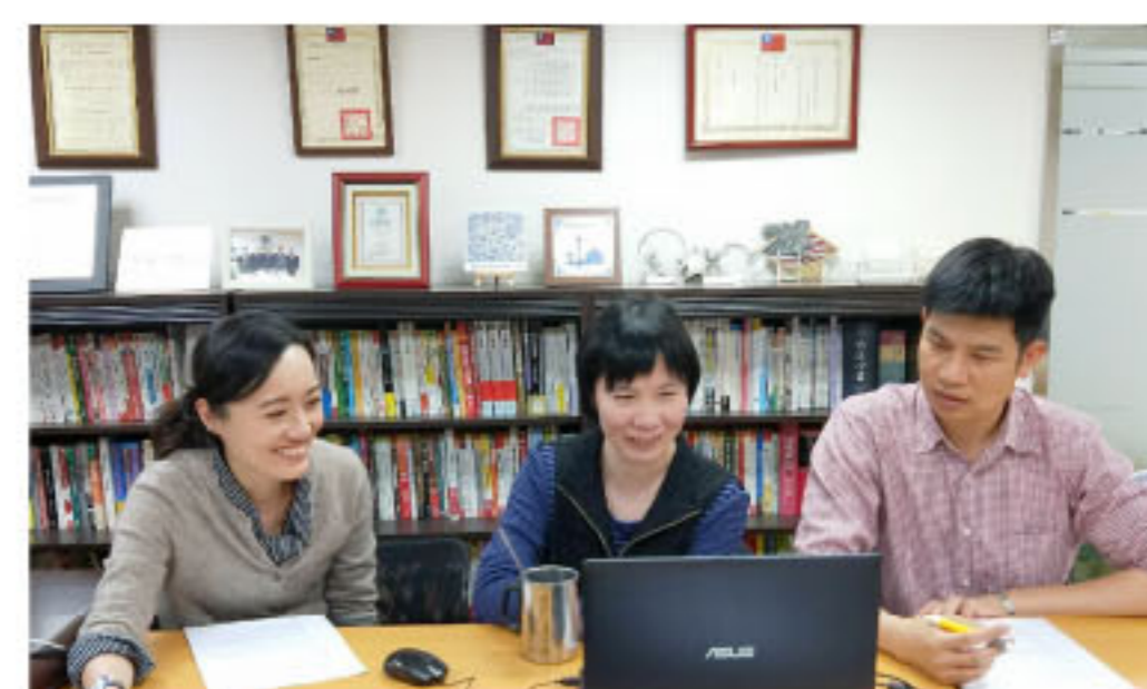
台泰日專業評鑑機構視訊會議