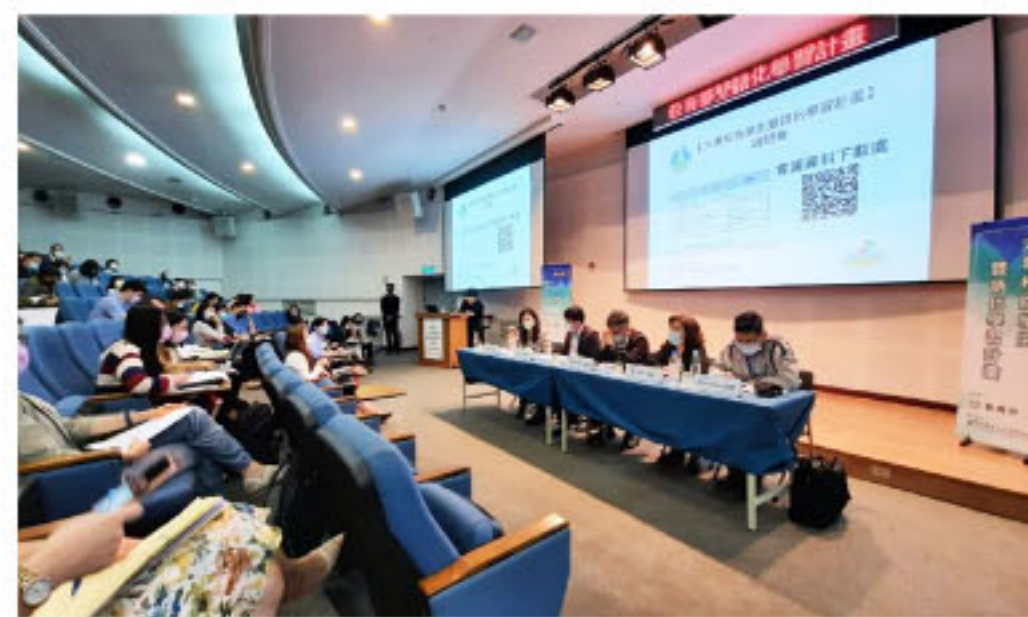
【大專校院學生雙語化學習計畫】全國政策說明會