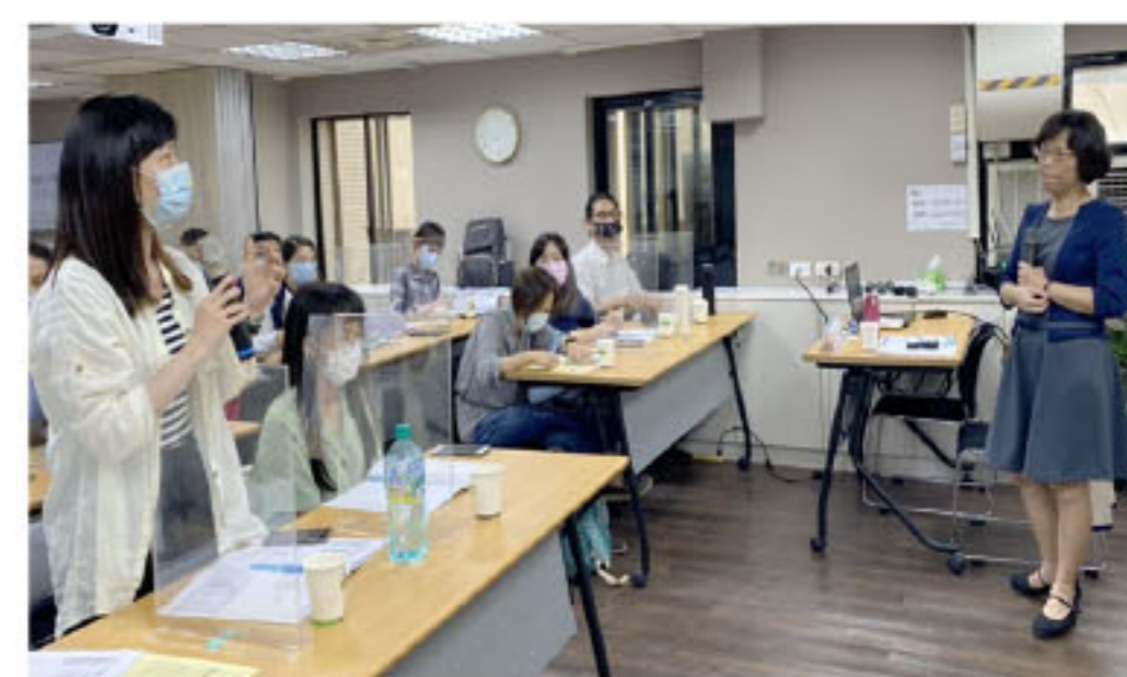
【大專校院教學品保研習活動】掌握關鍵，深植學校競爭力