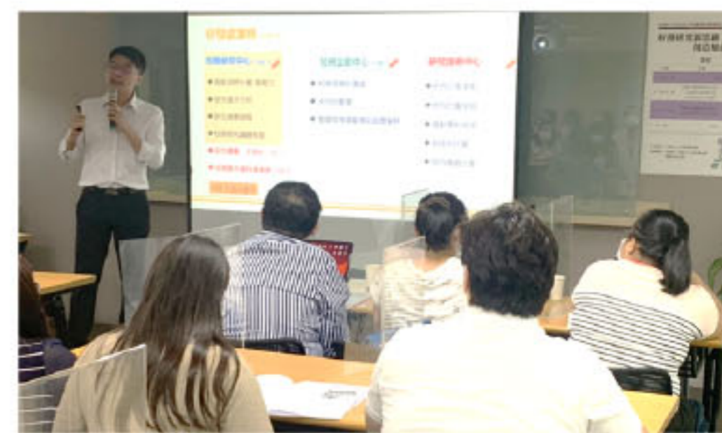
【IR躍升工作坊系列】校務研究新思維，創造增值新契機-校務專業管理策略研討