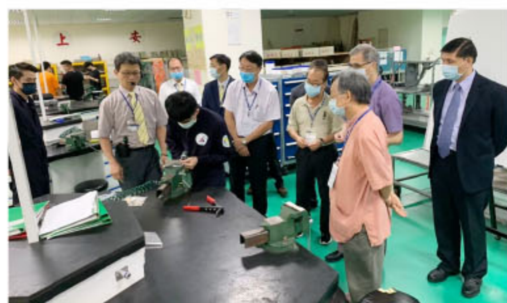
【優化技職校院實作環境計畫】109年度成果報告審查暨學校實地訪視作業