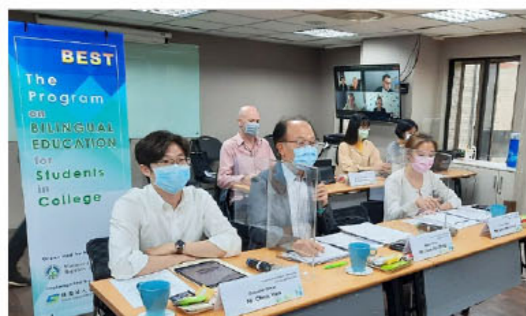
【大專校院學生雙語化學習計畫】國際學者專家第1、2、3、4次諮詢會議