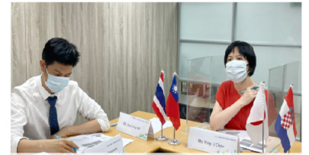
台、泰、日、克專業評鑑機構人員線上交流研習