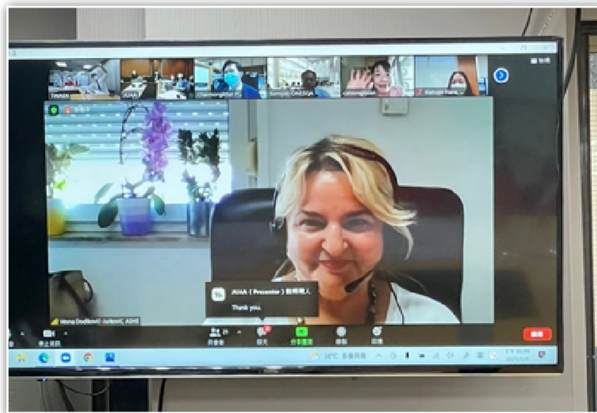
▲圖：台評會首邀克羅埃西亞專業評鑑機構參與台、泰、日線上人員交流實況