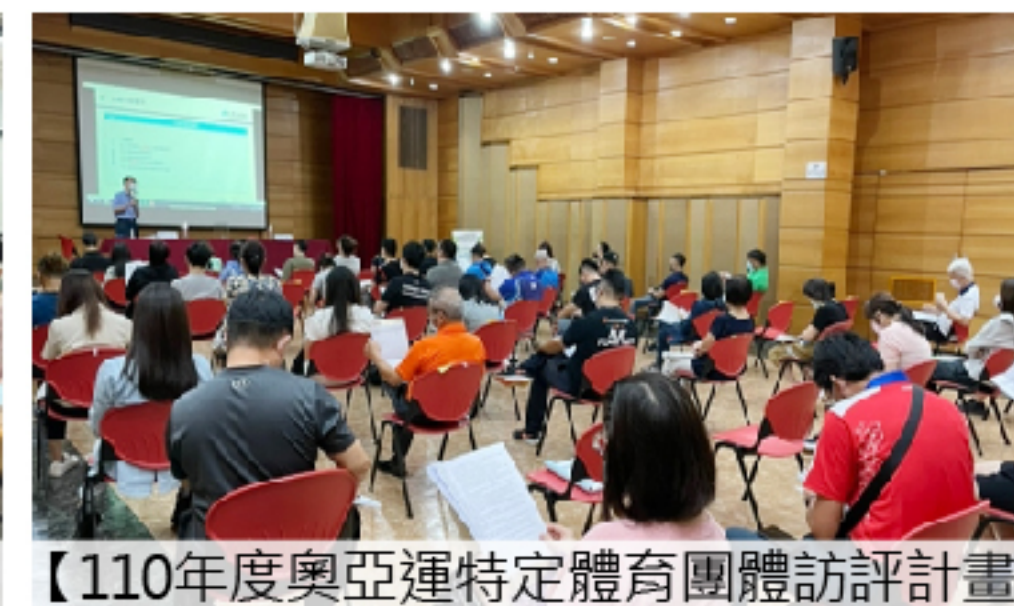
【110年度奧亞運特定體育團體訪評計畫】作業說明會