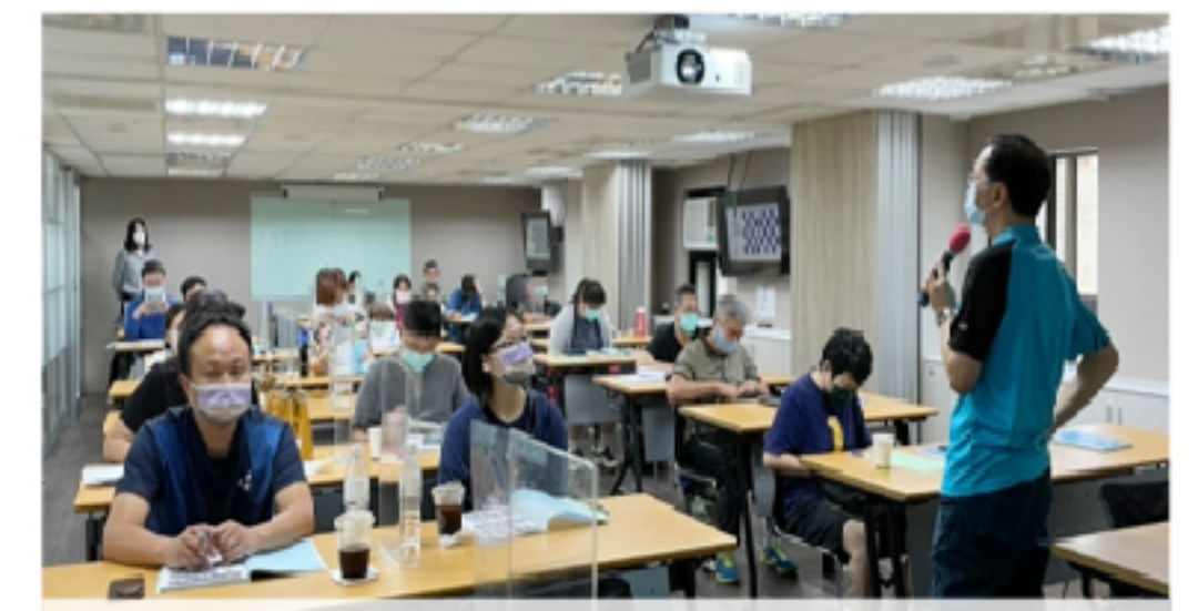
【110年度奧亞運特定體育團體訪評計畫】工作坊