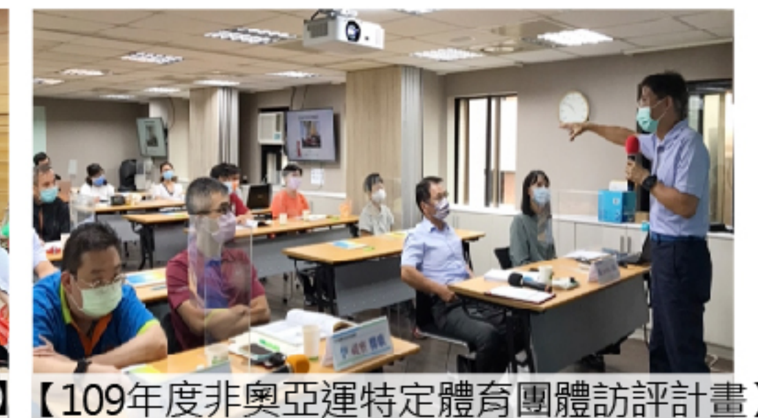
【109年度非奧亞運特定體育團體訪評計畫】研習工作坊