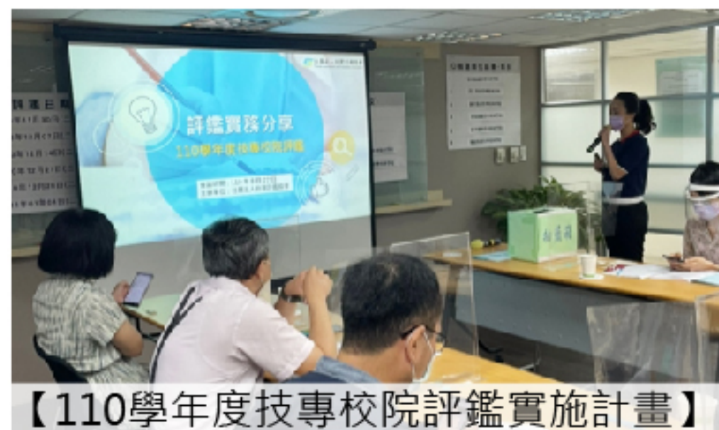
【110學年度技專校院評鑑實施計畫】學校說明會