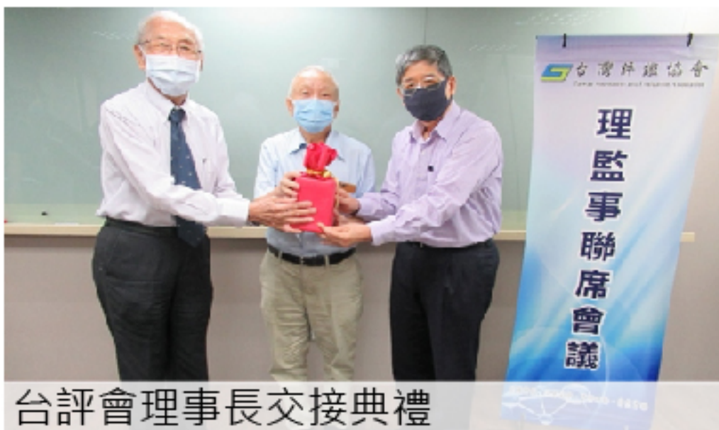
台評會理事長交接典禮