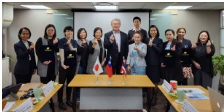
日本、泰國國際實習生首聚臺灣

台評會（TWAEA）、日本公益財團法人大學基準協會（JUAA）及泰國國家教育標準與品質評估局（ONESQA），自2017年起每年輪流辦理三方員工研習活動，疫情期間持續交流不中斷，仍以線上視訊方式進行互動研討，加強台評會與國際合作夥伴之緊密鏈結。基此，三方於2023年首度提出International Internship Program之構想，並由台評會擔任首輪計畫之主辦單位，由三方各自遴選1～2名代表擔任實習生參與活動。本年度繼8月17日線上開幕式後，配合台評會執行教育部科技校院評鑑計畫作業，分別於8月23日、10月2日及10月30日辦理3場線上交流活動，共同分享及探討多元主題；另於12月18～23日安排國際實習生來臺進行實地觀摩與考察，透過實際參與臺灣科技校院校務評鑑等行程，深化國際夥伴間之專業交流與合作關係。