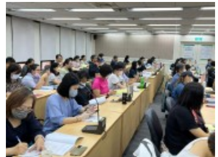
【113年度審查地方政府辦理社區大學業務暨全國社區大學申請獎勵實施計畫】 草案說明會暨地方政府實務工作坊