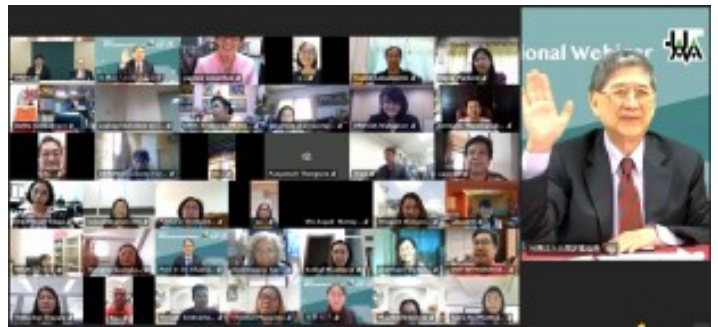
2023高等教育品質保證國際研討會