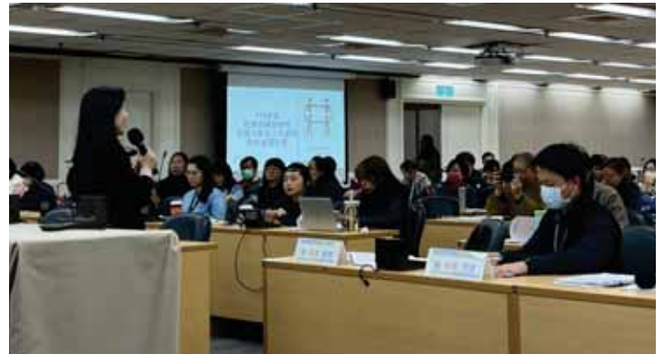
「教育部113年度補助辦理社區大學促進公共參與特色議題計畫」草案說明會