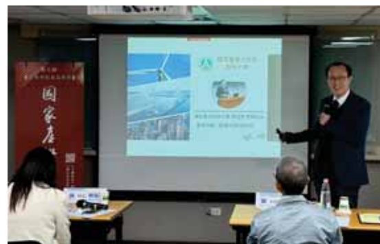
113年度國家產學大師獎遴選作業說明會