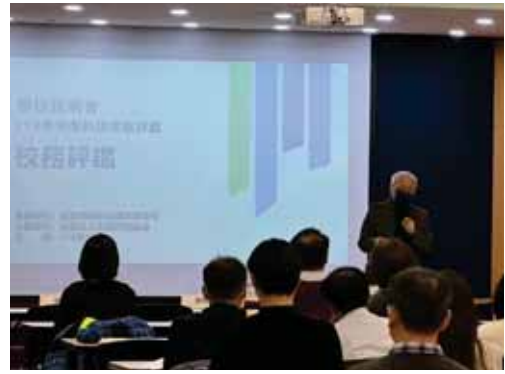
【113學年度科技校院評鑑計畫】學校說明會