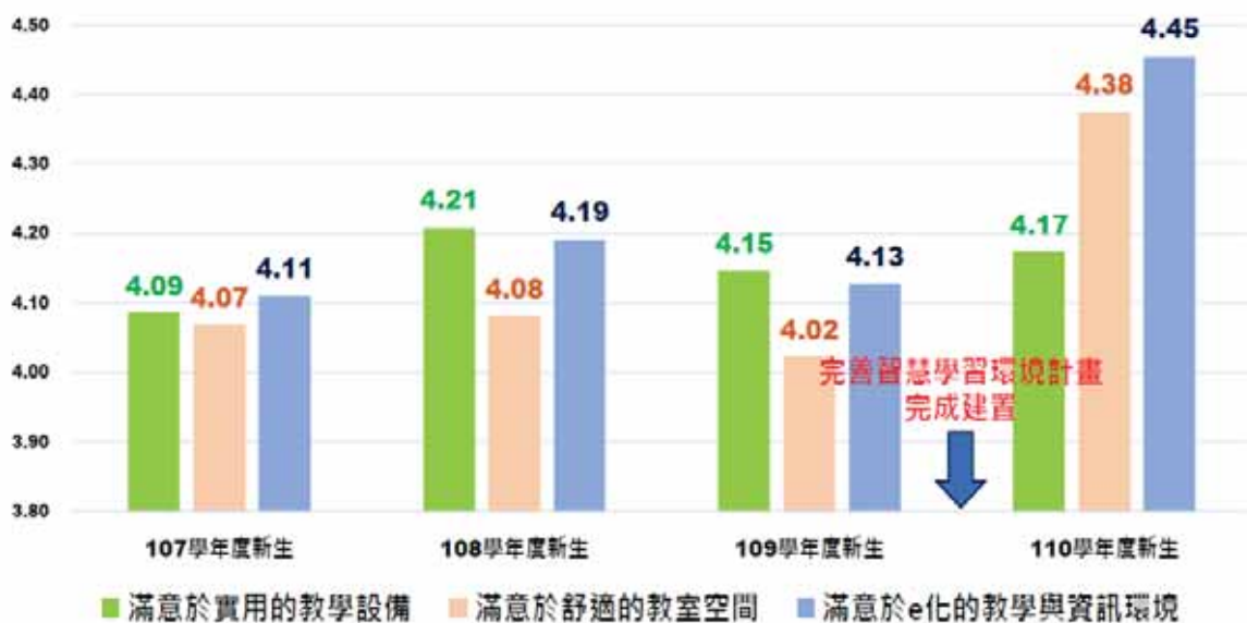
各年度學生對教室滿意度比較_以明明樓教室更新為例

註1:比較組為 107 至 109 學年度入學之新生，110 學年度入學之新生則為設備更新後第一屆使用對象，由本校校務研究中心分析整理。