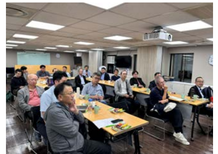
協辦由財團法人書香文化教育基金會主辦之「書香大師講堂」，許士軍教授主講 「一場沒有硝煙的社會經濟革命—資本主義下孵育的ESG運動」