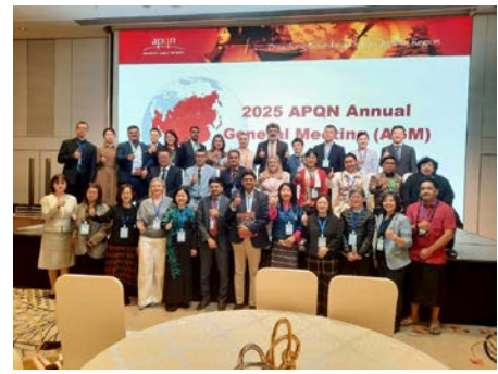
【國際交流】赴香港參與2025 APQN研討會