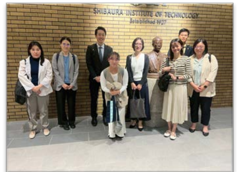
【2025國際實習計畫】台評會實習生赴日本進行實地體驗