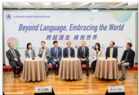
【大專校院學生雙語化學習計畫】啟動「EMI免試托福試辦計畫」記者會