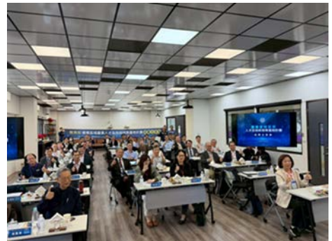
【建置區域產業人才及技術培育基地計畫】成果分享會